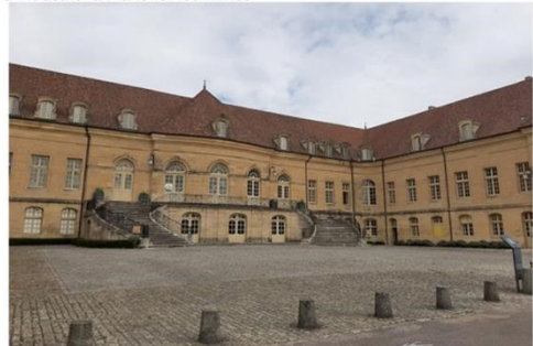
château de St Rémy