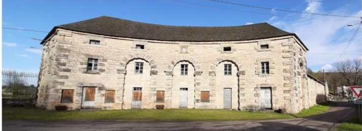
Forges de Baignes