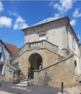
mairie lavoir de Beaujeu