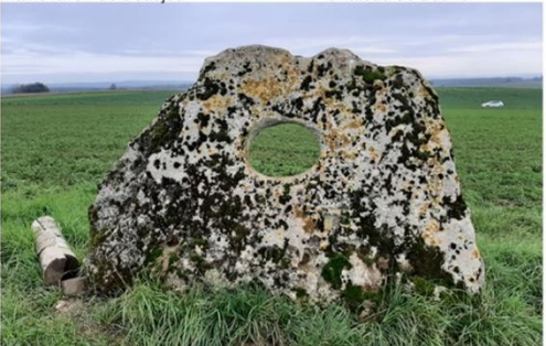
Pierre percée, Traves