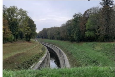
Canal de Scey-sur-Saone à St Albin