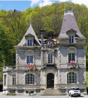
Maison d'industriel à Plancher-les-mines