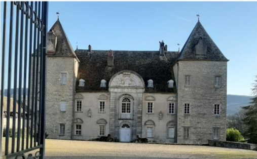
Château de Buthier